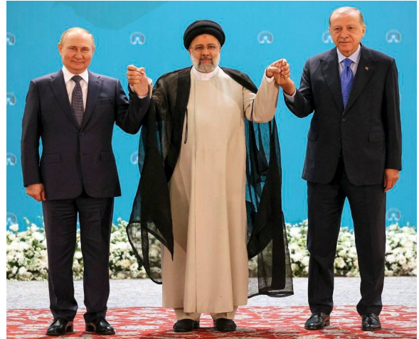
Rusland, Iran, Turkije (anti-Israël) alliantie