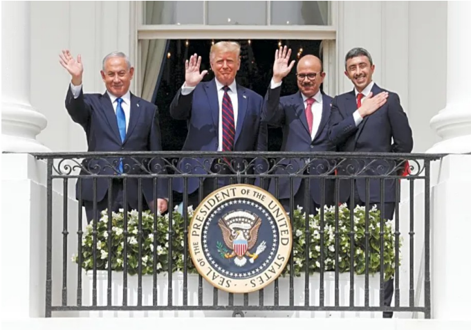
De Abraham Akkoorden tussen Israël, VS, Bahrain en VAE